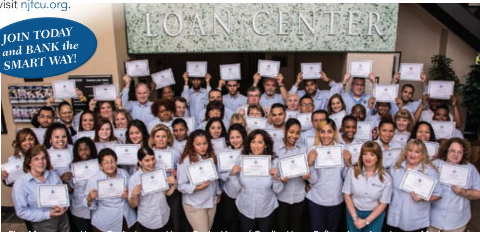
First Mortgages • Home Equity Loans • Home Equity Lines of Credit • Home Refinancing • Auto Loans • Much more!